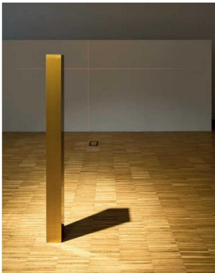
UMANO E DIVINO Qui sopra: l'opera A misura d'uomo , una colonna alta come la sagoma di Cristo nella Sindone, che proietta una croce sulla parete.

La mostra si compone di sei opere. La prima – Ascensione – ce la si trova sotto i piedi: gli scalini che conducono alla mostra sono coperti da sette gradazioni di blu, in un percorso che, a seconda che si salga o si scenda, procede verso il divino o l'umano. Annunciazione è un basamento rettangolare in legno con una parte concava che allude a un grembo materno e un giglio bianco: le misure sono quelle dell'altezza della madre dell'artista e della sua sezione aurea. I can't sea è il video di una ripresa buia del mare di notte, di cui si sente solo il rumore. «Volevo raccontare il mio navigare tra la paura e l'incertezza di rimanere fedele alla promessa. La promessa che all'alba quel suono troverà finalmente compimento, in una forma o in un colore». Se la strada potesse parlare è una parete da arrampicata formata da una serie di prese in gesso di diverse tonalità di blu. «Sono le infinite strade che l'uomo sceglie di percorrere per raggiungere la propria destinazione. La meta può essere diversa, ciò che conta non è arrivare in cima, ma il significato del percorso», spiega. Infine, A misura d'uomo è una colonna specchiante, alta come la sagoma di Cristo nella Sindone, con una livella laser inserita a 1.68 metri – l'altezza dell'artista – che proietta sulla parete buia una croce. Un'altezza umana ricavata in quella divina.